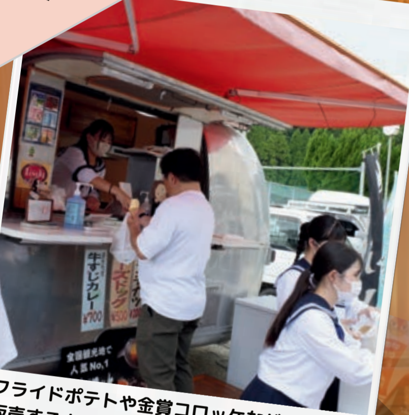
フライドポテトや金賞コロケなどを販売するキッチンカー!