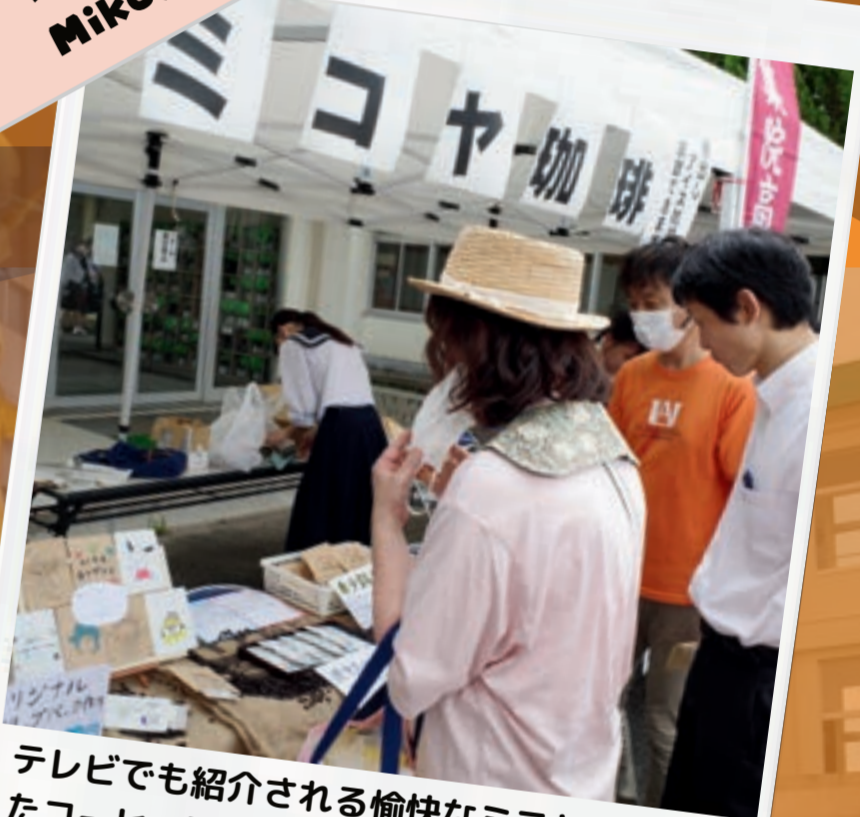
テレビでも紹介される愉快的なミコヤの厳選されたコーヒー豆を皆さんに!