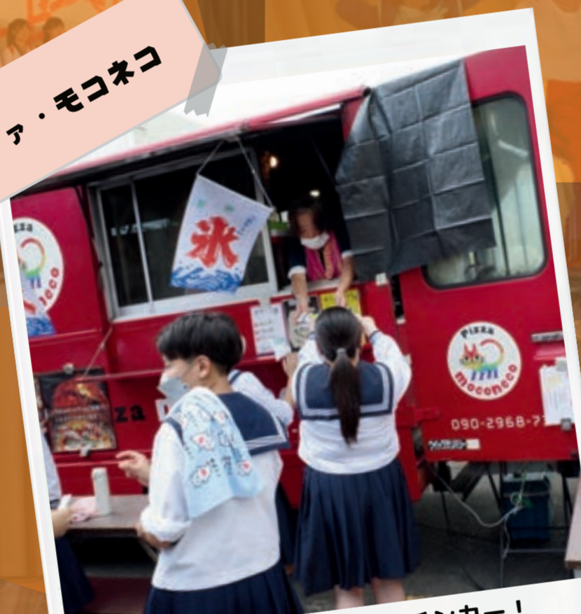
地元でおなじみのピザのキッチンカー! 当日は1ホール販売のみで長蛇の列!