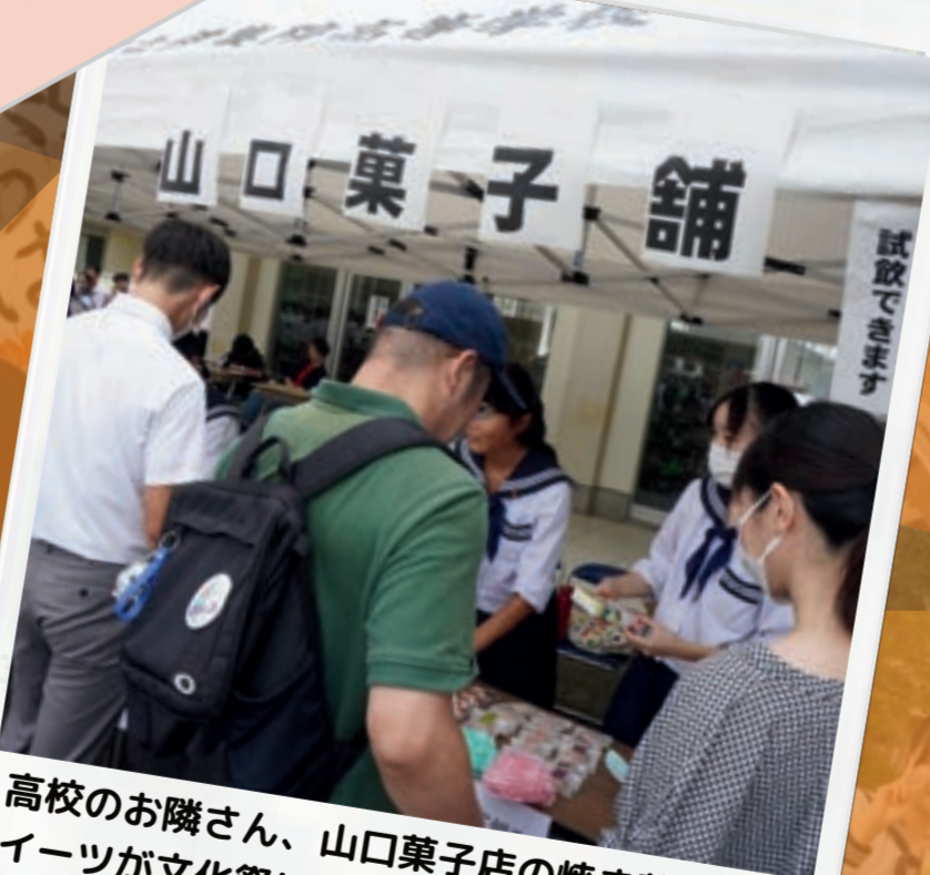
高校のお隣さん、山口菓子店の焼き菓子・スイーツが文化祭に登場!