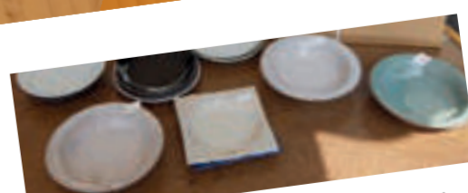
豊かな色彩ながらも、静かなひっそりとしたたたずみを見せる圭介窯の器。