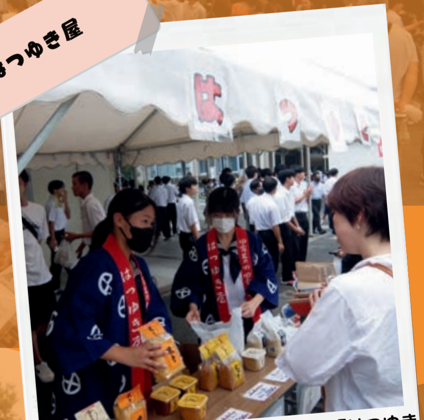
日本の食文化を世界に発信している『はつゆき屋』さんのお味噌と甘酒が文化祭に!